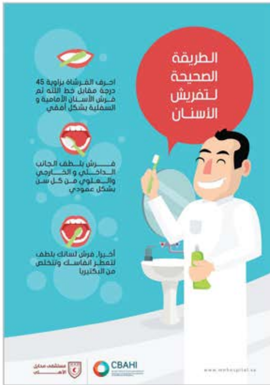
Type : A5 Flyer