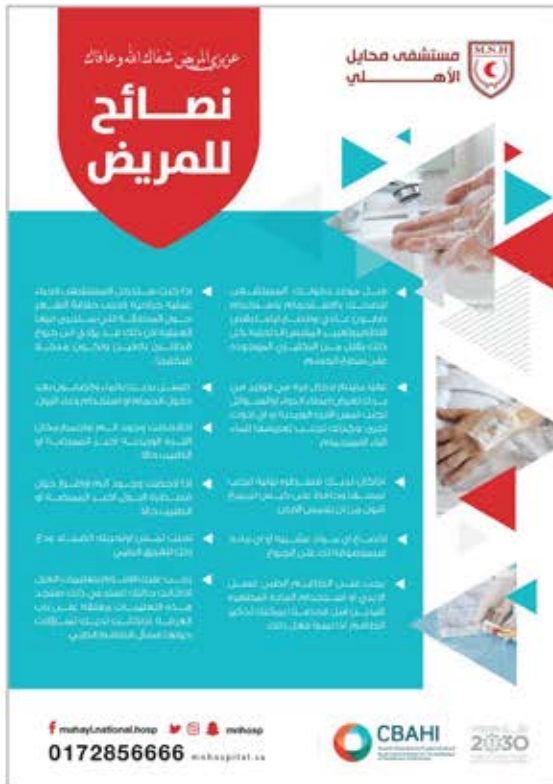
Type : A5 Flyer