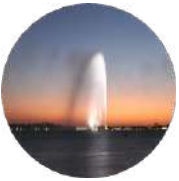
Gulf Research Center Jeddah (Main office)

19 Rayat Alitihad Street P.O. Box 2134 Jeddah 21451 Saudi Arabia Tel: +966 12 6511999 Fax: +966 12 6531375 Email: info@grc.net