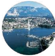
Gulf Research Center Foundation Geneva

Unit FN11A King Faisal Foundation North Tower King Fahd Branch Rd Al Olaya Riyadh 12212 Saudi Arabia Tel: +966 112112567 Email: info@grc.net