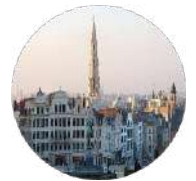
Gulf Research Center Foundation Brussels

University of Cambridge Sidgwick Avenue, Cambridge CB3 9DA United Kingdom Tel:+44-1223-760758 Fax:+44-1223-335110