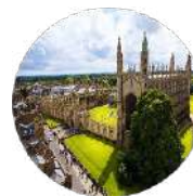
Gulf Research Centre Cambridge

Avenue de France 23 1202 Geneva Switzerland Tel: +41227162730 Email: info@grc.net