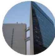
Gulf Research Center Riyadh

19 Rayat Alitihad Street P.O. Box 2134 Jeddah 21451 Saudi Arabia Tel: +966 12 6511999 Fax: +966 12 6531375 Email: info@grc.net